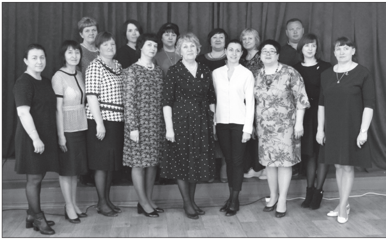
В День космонавтики, 12 апреля, состоялось очередное выездное заседание Управляющего совета Управления образования Ирбитского МО.

На этот раз темой обсуждения стала «Профориентационная деятельность, естественнонаучное образование и техническое творчество детей в системе дополнительного образования».